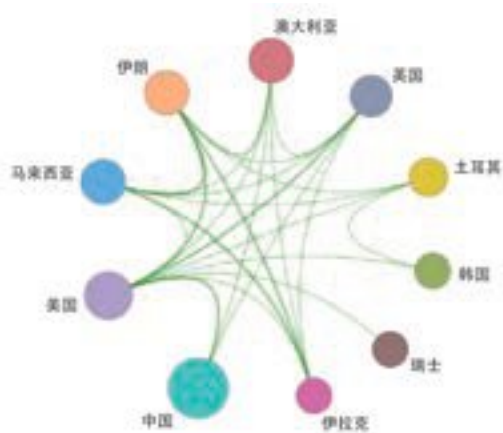
图 1.2.1 “基于地理时空大数据的智慧城市与智慧流域综合感知”工程研究前沿主要国家间的合作网络