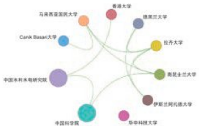
图 1.2.2 “基于地理时空大数据的智慧城市与智慧流域综合感知”工程研究前沿主要机构间的合作网络