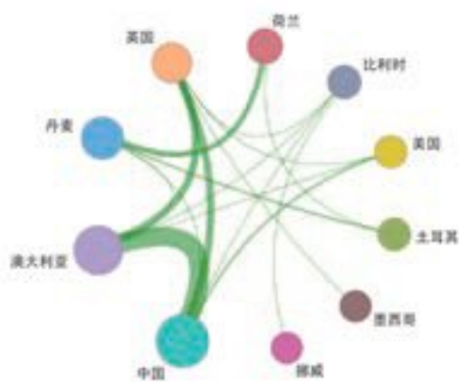
图 1.2.3 “风-浪-流和地震作用下海洋工程结构与海床地基系统的耦合响应机理”工程研究前沿主要国家间的合作网络